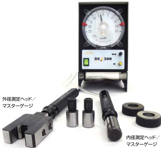
外径測定ヘッド/ マスターゲージ