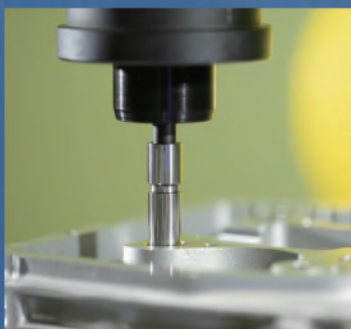
片口プラグゲージで 穴の通り止り検査