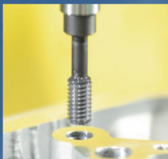
ねじプラグゲージで タップ穴の通り検査