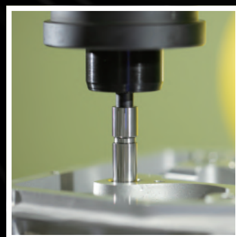
片口プラグゲージで 穴の通り/止りを検査

株式会社 第一測範製作所 HP URL https://www.issoku.jp E-Mail info@issoku.jp