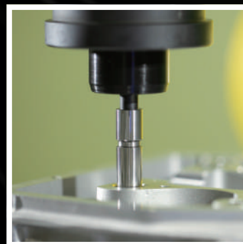
片孔プラグゲージで 穴の通り/止りを検査