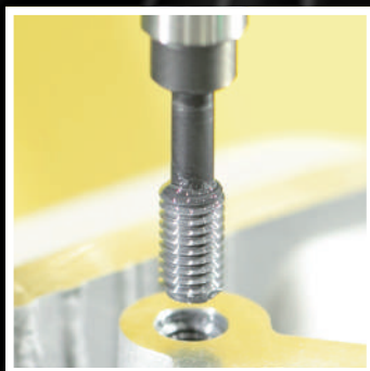
ねじプラグゲージで タップ穴の通り検査